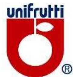
ユニフルーティ (チキータ)