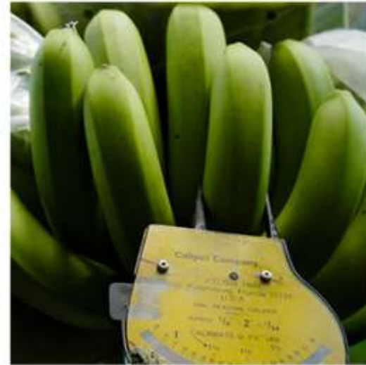
収穫のタイミング